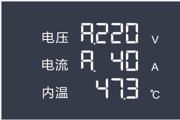
A相电压220V A相电流40A 内温47.3℃