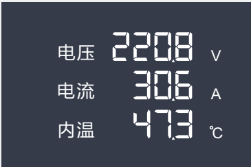
电压220.8V 电流30.6A 内温47.3℃